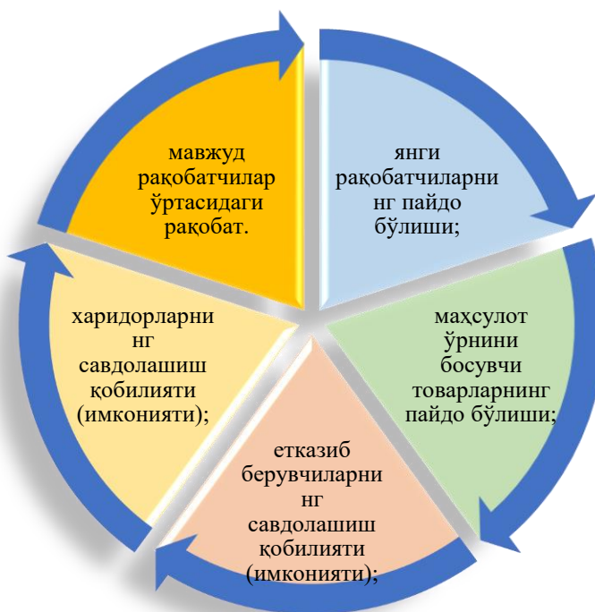
1-расм. Саноат структурасини шакллантирувчи рақобат кучлари 8

М.Портер бозор концепциясининг етакчи вакили сифатида тан олинган. У рақобат назариясини биринчилардан бўлиб тизимлаштиришга муваффақ бўлган. Тармоқда рақобат муҳитининг кучи, рақобат стратегияси ва рақобат устунликлари – Портер моделининг моҳияти ушбу уч омилнинг мужассамлиги билан рақобат назариясини шакллантириш бўлган. Унинг фикрига кўра, ҳар қандай тармоқ ва соҳада рақобатнинг интенсивлиги ва кутилаётган фойда ҳажми саноат структурасини шакллантирадиган қуйидаги рақобат кучларининг ўзаро таъсири билан белгиланади 7 (1-расм):