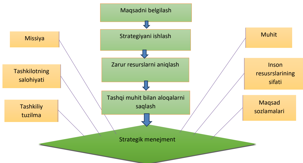
1-rasm. Strategik menejmentni ishlab chiqish va amalga oshirish jarayonlari 1

resurslarni aniqlash; tashkilotga o‘z maqsadlariga erishish imkonini beruvchi tashqi muhit bilan aloqalarni saqlash (1-rasm).