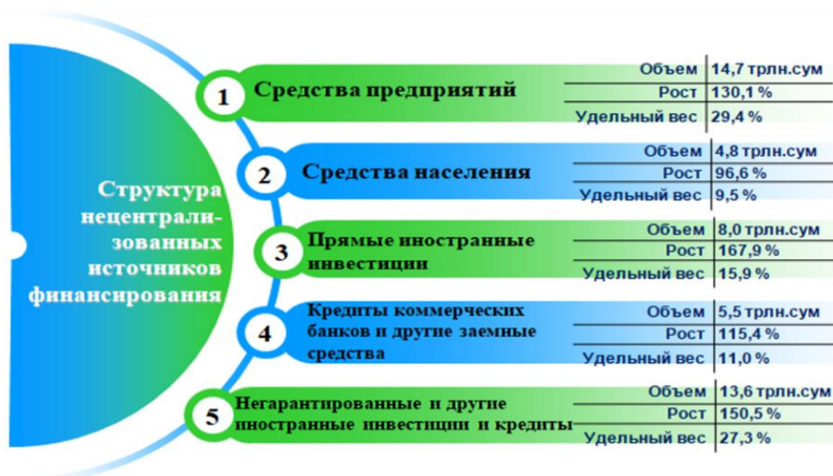
Рисунок 3. Структура нецентрализованных источников финансирования в % и трлн.сум.[13]

С привлечением прямых иностранных инвестиций внедряются новые технологии, появляются новые виды товаров и услуг, что создает основу для дальнейшего повышения качества товаров и услуг и, в конечном счете, улучшения жизни населения, усиления конкуренции в национальной экономике.