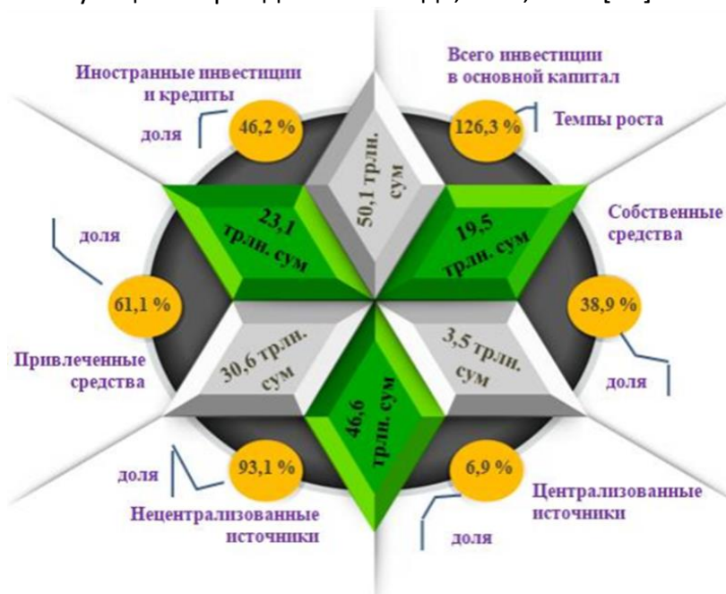
Рисунок 2. Освоение инвестиций в основной капитал в % и трлн.сум [21].

Соответственно за счёт нецентрализованных источников финансирования было освоено 46,6 трлн. сум инвестиций, или 93,1 % от их общего объёма, что больше, по сравнению с соответствующим периодом 2021 года, на 5,1 п.п.[11].