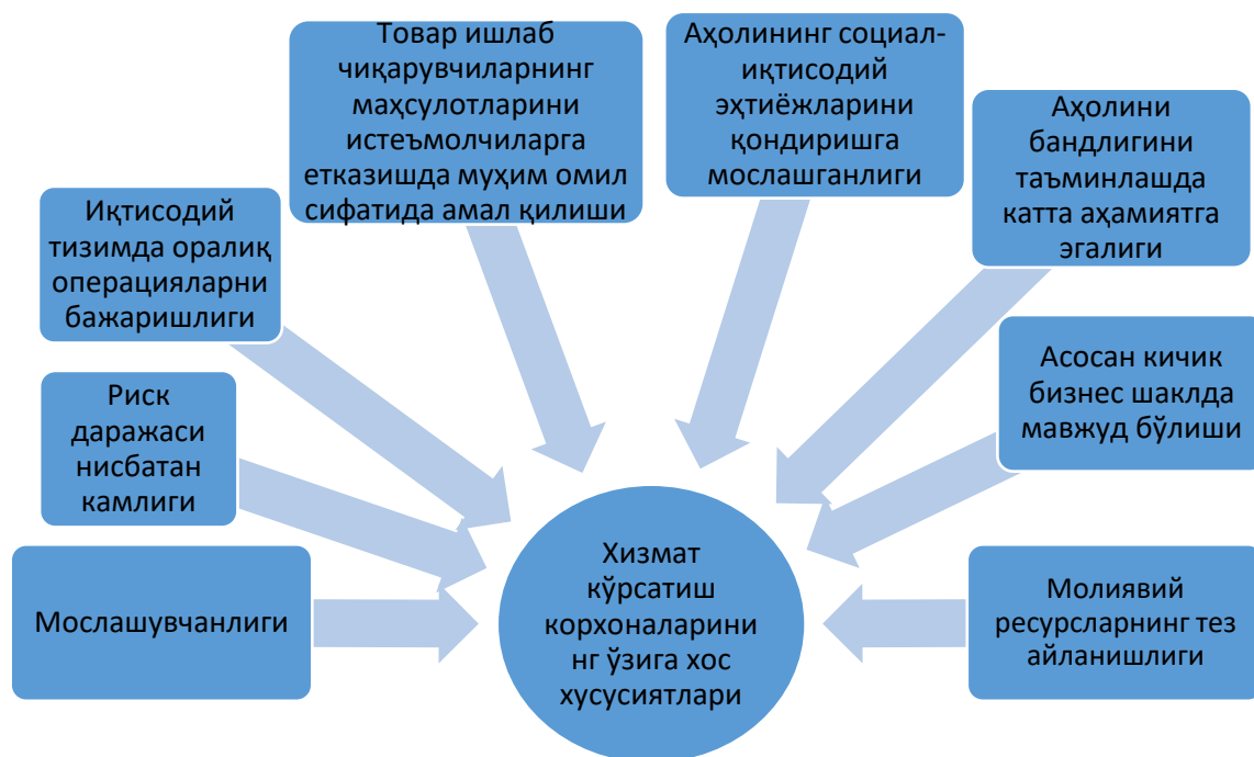
2-расм. Хизмат кўрсатиш корхоналарининг ўзига хос хусусиятлари 4

Иккинчидан , унинг мослашувчанлиги бу турдаги корхоналарнинг бошқа бир муҳим хусусияти-нисбатан риск даражасининг камлигини ҳам кўрсатади, бу каби корхоналарни ташкил қилишда унга тикилган молиявий сармояларни қайтиши ва самарадорлик кўрсаткичларини келтиришида риск бошқа йирик корхоналарга нисбатан камроқ бўлади, бу эса хизмат кўрсатиш корхоналарига инвестицияларнинг оқимининг ортишига ва бу турдаги корхоналарнинг ошишига муҳим омил бўлади.