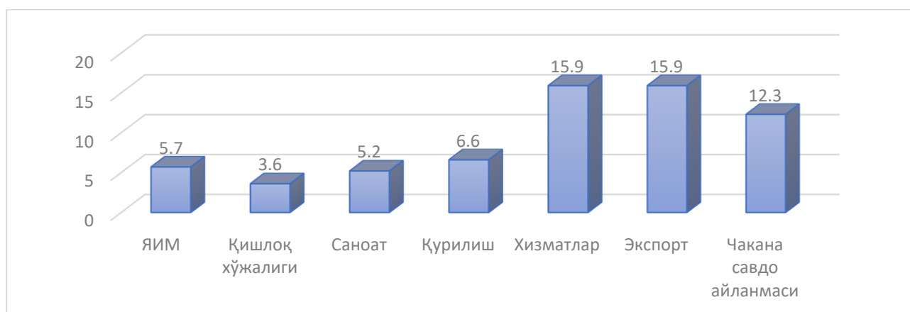
1-расм. 2022 йилда Ўзбекистон Республикасининг макроиқтисодий кўрсаткичлари 1 (фоизда)

Таҳлилларга кўра, 2022 йилда ялпи ички маҳсулот (ЯИМ) 5,7 фоиз, саноат маҳсулотлари 5,2 фоиз, қурилиш ишлари 6,6 фоиз, қишлоқ хўжалиги маҳсулотлари 3,6 фоизга, хизматлар 15,9 фоиз, экспорт 15,9 фоиз, чакана савдо айланмаси 12,3 фоиз ўсиш суръатлари кузатилди (1-расм).