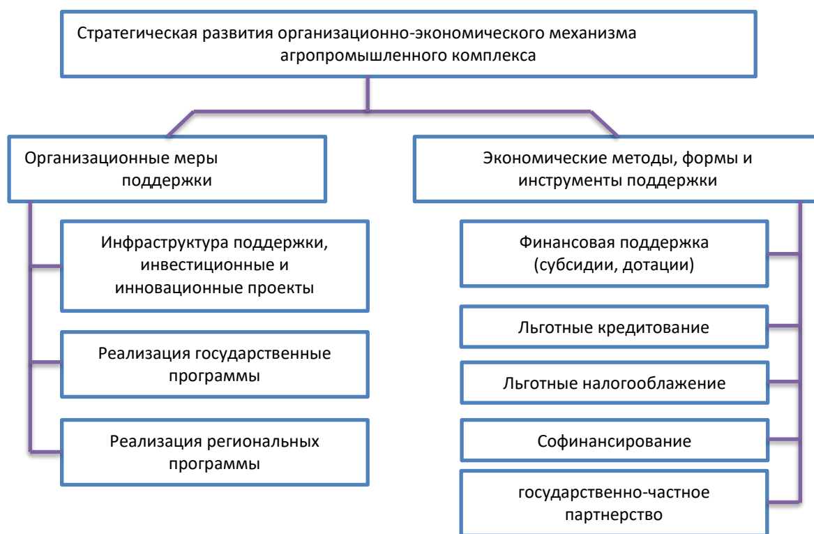
Рис. 3. Стратегические ориентиры развития организационно-экономического механизма агропромышленного комплекса

В современных социально-экономических условиях трансформация является неизбежным вектором развития организационно-экономического механизма агропромышленного комплекса, поскольку сопровождается изменением свойств элементов, их связей, взаимосвязей и пропорций, обуславливая суброгацию в новое качественное состояние. Трансформация носит объектно-субъектный характер, проявляющийся в действии объективных экономических законов и иницируемых субъектами преобразований, проходящих с определенной скоростью и вектором изменений [16].