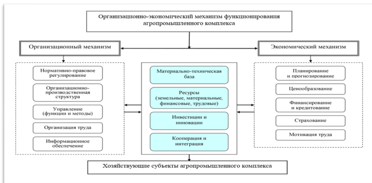
Рис. 2. Основные элементы организационно-экономического механизма агропромышленного комплекса

Второй блок – экономический механизм, включающий субсидирование, льготное налогообложение, финансирование и кредитование и т.д.