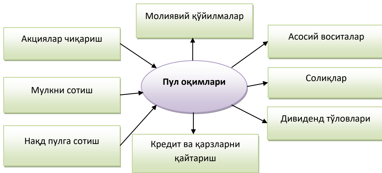
1-расм. Кичик бизнес субъектлари фаолиятидаги пул оқимлари*