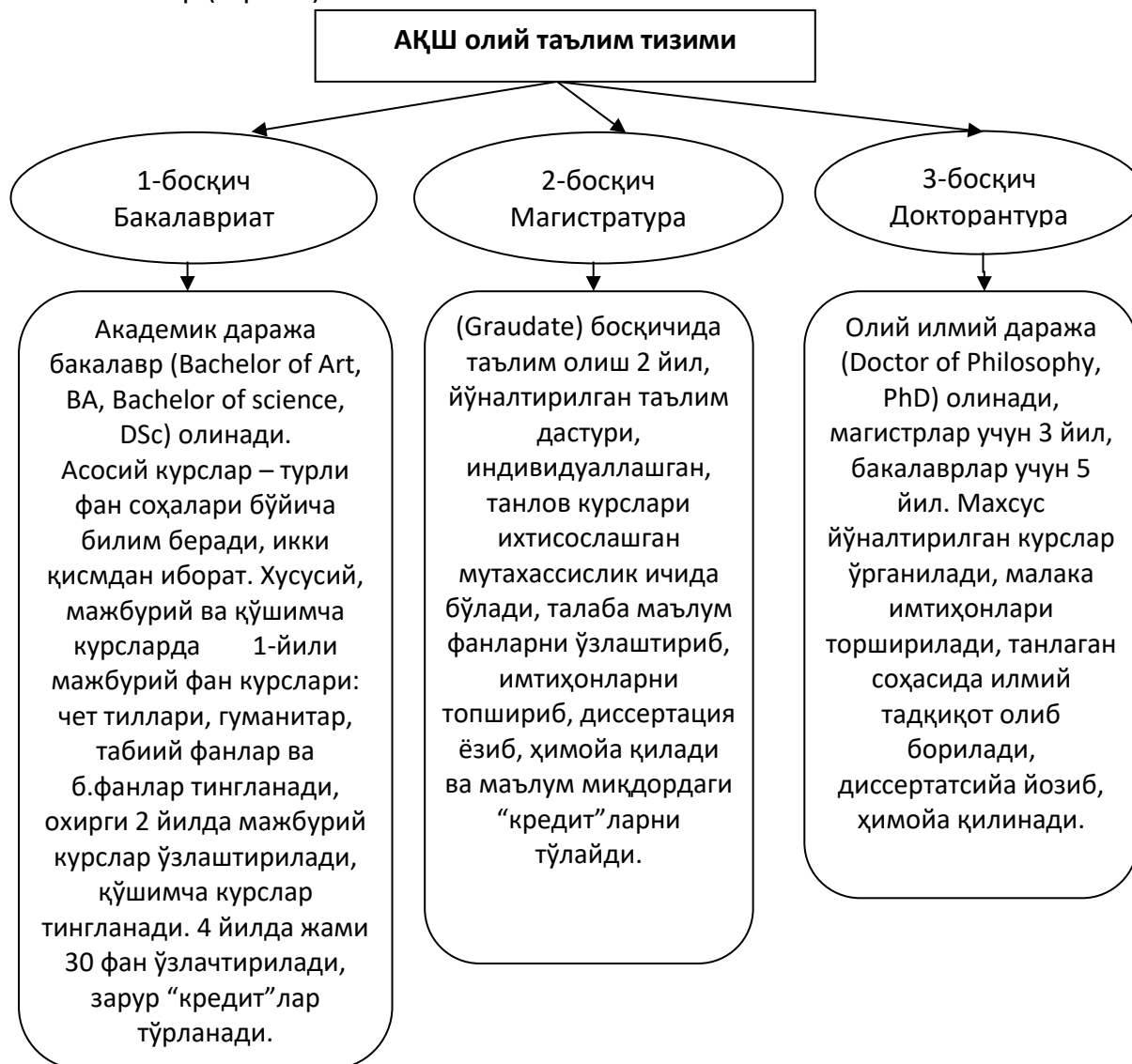
2-расм. АҚШда олий таълим тизими [11]

Ўзини яхши педагог ва тадқиқотчи этиб кўрсатса ассоциатив-профессор лавозимига тайинланади, 10 йил ишлагандан сўнг энг олий академик лавозим - тўлиқ профессор лавозими таклиф этилади. Таркиб 1- ва 2-даражаларда доимо янгиланиб, вақт меъёрида ўзгартирилиб турилади ва қолган 2 даража лавозимларида умрбод қолиш имконияти бор (2-расм).