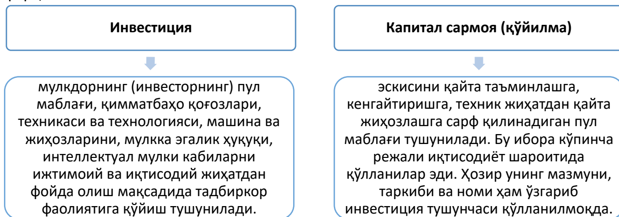
1-расм. “Инвестиция” ва “капитла қўйилма” категорияларининг ўзаро фарқланиши [13]