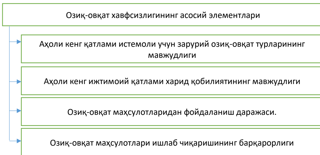
1-расм. Озиқ-овқат хавфсизлигининг асосий элементлари ташкилий тузилмаси*.