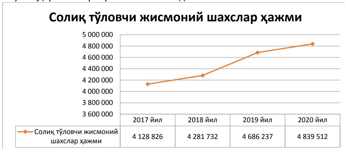
2-расм. Республика миқёсида 2017-2020 йиллар жисмоний шахслар даромад солиғи тўловчилар сонининг ўзгариши 2

2019-йил солиқ сиёсатимизда олиб борилган туб ислохатларининг натижаси билан боғлаган бўлар эдик. Яъни, жисмоний шахслар даромад солиғи олдинлари 4 та шкалада прогрессив ставка асосида ҳисобланган бўлса, ҳозирги пайтда пропорционал ставкада ҳисобланмоқда. Албатта, бу солиқ базаси билан чамбарчас боғланган. Шунингдек, республикаимизда жисмоний шахслар даромад солиғи тўловчилар сони ҳам бу миқдорга таъсир этувчи омил саналади.