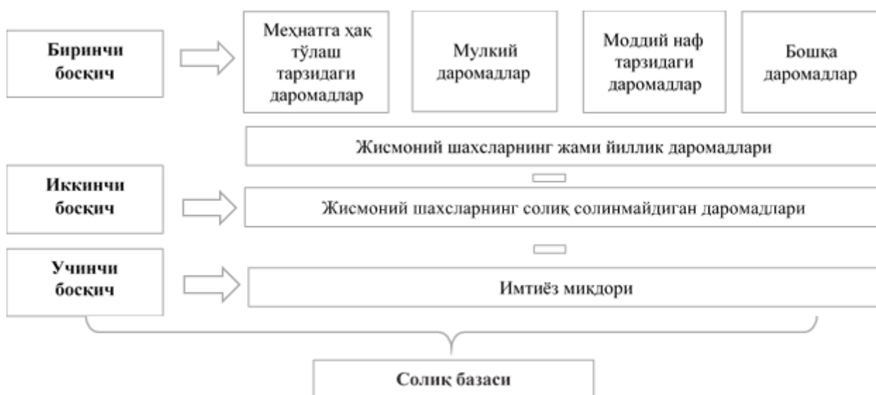
4-расм. Жисмоний шахслардан олинадиган даромад солиғининг базасини аниқлаш тартиби 5 .

Гувоҳи бўлганингиздек, юқорида берилган жисмоний шахслар даромад солиғи базасини аниқлаш жараёнида эътибор қаратишимиз лозим бўлган жиҳатлар бу қандай даромадлар базага киритилгани, қандайлари даромад сифатида тан олинмагани ва имтиёзлар кўлами ҳисобланади.