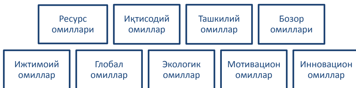
2-расм. Озиқ-овқат саноати корхонасини ташкилий-иқтисодий механизмини амал қилиши самарадорлигига таъсир кўрсатувчи омиллар 2

-озиқ-овқат маҳсулотлари нархини барқарорлиги [6]. Бу тамойил мамлакатда озиқ-овқат маҳсулотлари нархини кескин ортиши натижада бу турдаги маҳсулотларга бўлган талаб ҳажмини қондириш кўзда тутилади.