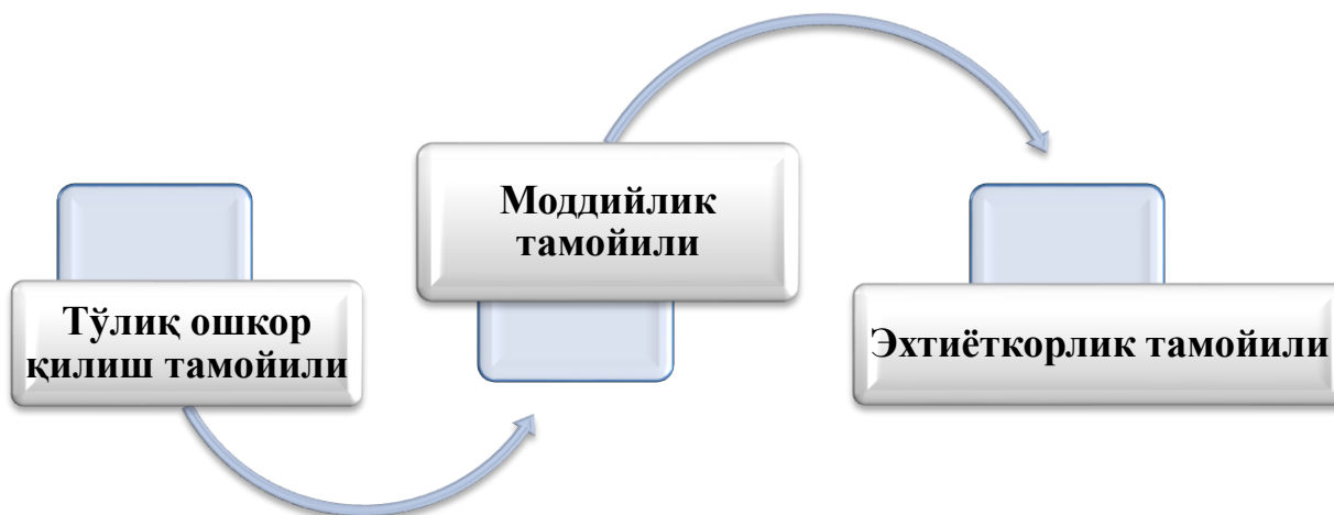
2-расм. Бухгалтерия ҳисобининг муҳим тамойиллари.