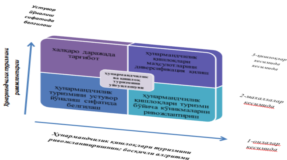
2-расм. Ҳунармандчилик қишлоқлари туризмни ривожлантиришнинг босқичли алгоритми 9

Бироқ, тобора чуқур ва кенг қамровли халқаро интеграция шароитида Фарғона водийсида туризмнинг инсон ресурслари ҳали ҳам туризм саноати талабларига жавоб бермайдиган кўплаб жиҳатларга эга. Ушбу юқоридаги масалаларни ҳал этиш жараёнида қуйидаги таклифларни амалга оширишнинг босқичли алгоритми ишлаб чиқилди (2-расм).