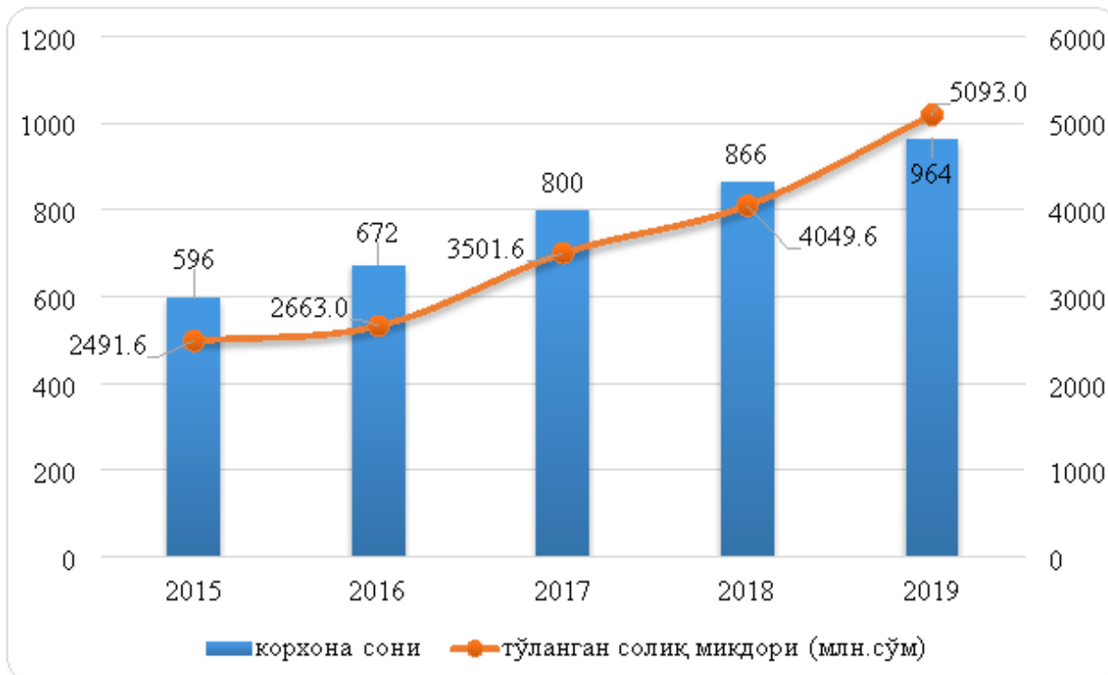
1-расм. Сурхондарё вилоятида чорвачилик маҳсулотлари етиштиришга ихтисослаштирилган қишлоқ хўжалиги корхоналари ва улар томонидан тўланган солиқлар миқдори 4 (млн. сўм).

Тадқиқотимиз давомида сўнгги беш йилда Сурхондарё вилоятида чорвачилик маҳсулотлари етиштиришга ихтисослаштирилган қишлоқ хўжалиги корхоналари ва улар томонидан тўланган солиқлар миқдорини таҳлил қилдик (1-расм).