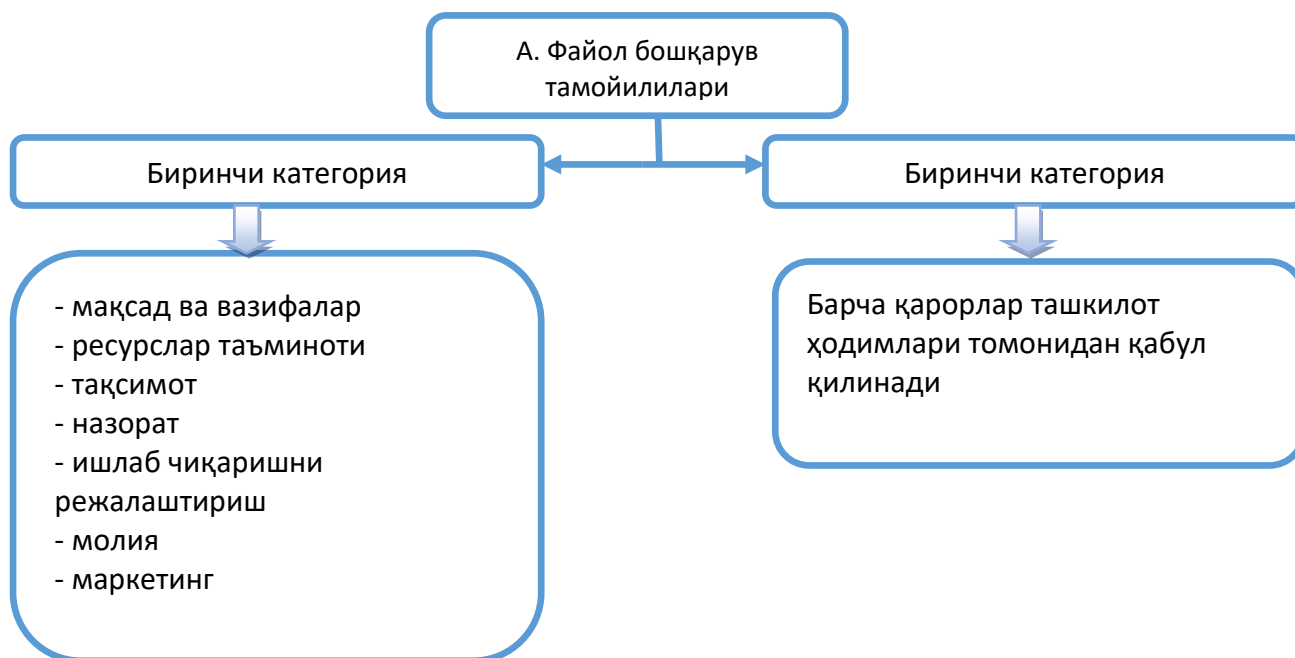
2-расм. А. Файолнинг бошқарувнинг универсал тамойиллари

Юқорида айтилгани каби, А.Файол асос солган мактаб вакиллари томонидан бошқарувнинг универсал тамойиллари ишлаб чиқилган бўлиб, бунда биринчи категория бошқарув усулида мақсад ва вазифаларни белгилаш, ресурслар таъминоти ва тақсимоти, назорат, ишлаб чиқаришни режалаштириш, молия ва маркетинг масалалари бошқарув иерархиясининг энг юқори бўғини томонидан амалга оширилади. Иккинчи категорияда эса ташкилот фаолиятига доир юқорида санаб ўтилган бошқарув функциялари ташкилот бошқарув иерархиясининг энг юқори бўғини томонидан эмас, балки ташкилот ходимлари томонидан мустақил равишда амалга оширилади. Кўплаб ғарб давлатларининг таълимни бошқарув моделида айнан мана шу иккита категориянинг ҳар биридан фойдаланиб келинишини кузатиш мумкин.