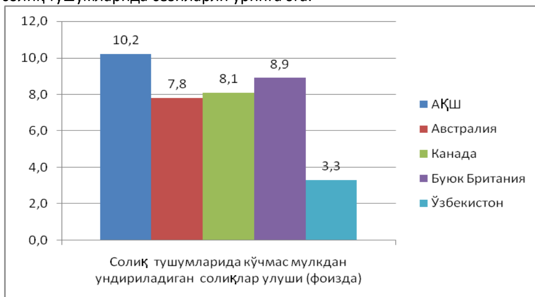
2-расм. Ривожланган давлатлада кўчмас мулкдан ундириладиган солиқларнинг жами солиқ тушумларидаги улуши 5

Ривожланган давлатлар тажрибасида кўчмас мулкдан ундириладиган солиқлар жами солиқ тушумларида сезиларли ўринга эга.