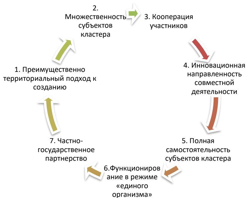
Рис. 1. Основные принципы построения кластера [4]

Фридман Ю.А. выделил основные принципы построения кластера Рис. 1.