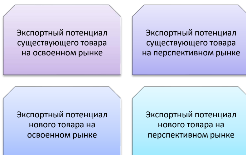
Рис. 3. Направления развития локального экспортного потенциала предприятия [7]

Рост экспортного потенциала предприятия может быть рассмотрен в двух направлениях: товарном и территориальном (географическом). В первом случае имеется в виду повышение конкурентоспособности ранее произведенной либо вновь созданной продукции. Второе направление подразумевает выход на новые рынки сбыта или рост сбыта на ранее освоенных рынках. Исходя из вышесказанного, можно выделить четыре переменных экспортного потенциала предприятия: существующий товар, новый товар, освоенный рынок, перспективный рынок. Комбинация вышеназванных переменных позволяет определить четыре направления развития локального экспортного потенциала промышленного предприятия рис. 3.