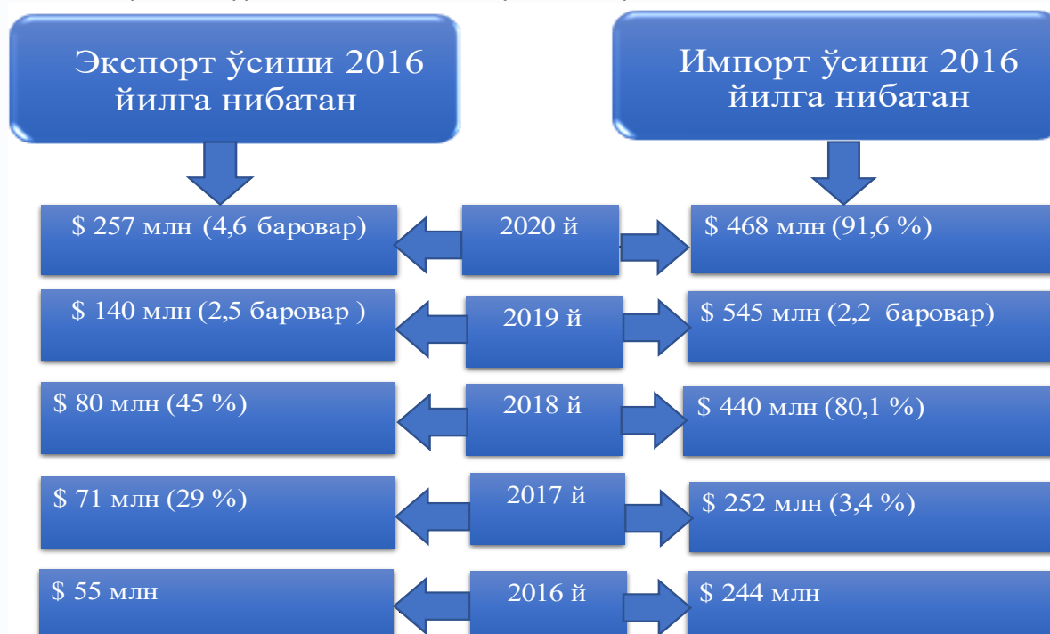
2-расм. 2016-2020 йилларда Ўзбекистонда қурилиш материаллари саноати соҳасида экспорт ва импорт ҳажми

2016-2020 йилларда Ўзбекистонда қурилиш материаллари саноати соҳасида эришилган натижалар бўйича таҳлилларини келтириб ўтсак. Таъкидлаш кераки, 2020 йилда 257 млн. АҚШ долларлик қурилиш маҳсулотлари экспорт қилинган бўлиб, 2016 йилга нисбатан 4,6 баробарга ўсганлигини кўриш мумкин. Шунингдек қурилиш маҳсулотлари импорт ҳажми 2020 йил 468 млн. АҚШ долларни ташкил этиб, 2016 йилга нисбатан 91,6% га ошган. Натижада, Ўзбекистонда қурилиш материаллари ишлаб чиқариш ҳажми ўсганлигини, ишлаб чиқарилаётган қурилиш материалларига бўлган талаб маҳаллий бозордаги истеъмоли ва жаҳон бозорига экспорт улушининг ошганлиги орқали кўришимиз мумкин бўлади.(2-расм)